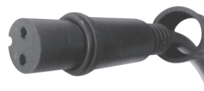
fig. 2. / 2. ábra / obraz 2. / Figura 2. / 2. skica / obraz 2.