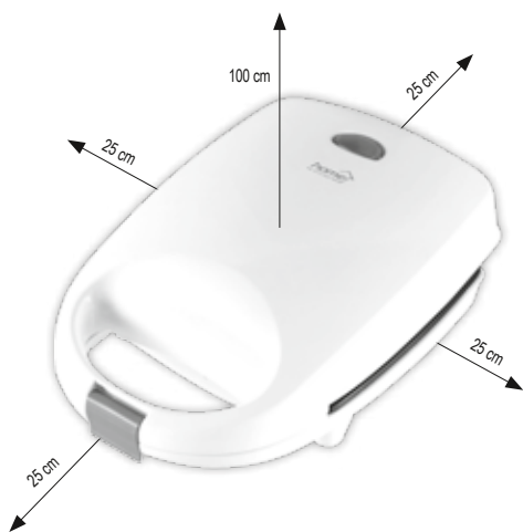
figure 2. • 2. ábra • 2. obraz • figura 2. • 2. skica • 2. skica • 2. obrázek • 2. slika