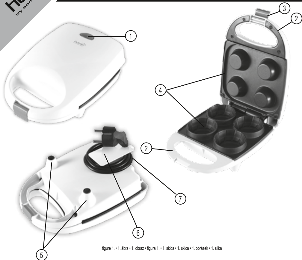
figure 1. • 1. ábra • 1. obraz • figura 1. • 1. skica • 1. skica • 1. obrázek • 1. slika